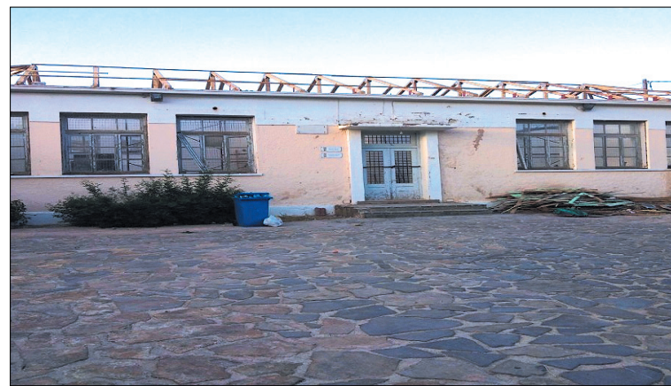
Η επισκευή της στέγης του σχολείου

Μετά το τέλος της λειτουργίας ακολούθησε ο εσπερινός της γονυκλισίας και η ευλόγηση των άρτων. Στη συνέχεια πραγματοποιήθηκε η καθιερωμένη λιτάνευση της εικόνας της Αγίας Τριάδος στους κεντρικούς δρόμους του χωριού. Στο τέλος της λειτουργίας κατά την έξο-