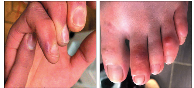
Τυπικές περιπτώσεις ψευδο-χείμετλων της COVID-19: ερυθρο-ιώδεις, οιδηματώδεις βλάβες των δακτύλων.

VI. Οιδηματώδεις, ερυθρο-ιώδεις κηλιδοβλατίδες των δακτύλων (συνήθως των ποδιών), που εμφανίζουν μερικές φορές και φυσαλιδο-πομφόλυγες. Σπανιότερα εμφανίζονται στις φτέρνες, τα πέλματα ή και τα δάκτυλα των χεριών, και μπορεί να συνοδεύονται από ελαφρό κνησμό ή πόνο. Οι βλάβες αυτές αντιπροσωπεύουν 19%-40% όλων των δερματικών εκδηλώσεων (ανάλογα με τις μελέτες), μοιάζουν πολύ με τα κοινά χείμετλα (χιονίστρες) και αναφέρονται στην βιβλιογραφία ως «ψευδο-χείμετλα» («chilblain-like lesions» ή «δάκτυλα COVID»). Περισσότερα από 1.000 τέτοια περιστατικά έχουν δημοσιευτεί παγκοσμίως. Έτσι τα ψευδο-χείμετλα αποτελούν μια χαρακτηριστική και αναγνωρίσιμη εκδήλωση σχετιζόμενη με την COVID-19, αν και ο ρόλος του SARS-CoV-2 παραμένει ακόμα ανεξακριβωτός εφόσον στην πλειοψηφία των ασθενών δοκιμασίες για COVID-19 ήταν αρνητικές. Τα ψευδο-χείμετλα εμφανίζονται συνήθως σε νέα άτομα, παιδιά, εφήβους ή και νεαρούς ενήλικες (μέσος όρος ηλικίας 25 έτη), σε αντίθεση με τις υπόλοιπες δερματικές βλάβες που προσβάλλουν άτομα μεγαλύτερης ηλικίας. Τα άτομα με ψευδο-χείμετλα κατά κανόνα δεν εμφανίζουν έντονα συμπτώματα COVID-19 ή είναι τελείως ασυμπτωματικά (φαινομενικά υγιά). Οι βλάβες αυτές αναπτύσσονται σχετικά όψιμα σε σχέση με την λοίμωξη, δηλαδή μετά την εμφάνιση των πρώτων συμπτωμάτων της νόσου (όταν υπάρχουν). Η αιτιοπαθογένειά τους παραμένει άγνωστη.