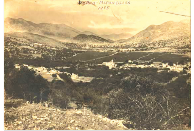
Ο κάμπος και τα χωριά της Φουρνής το έτος 1925. Αριστερά η Επάνω Φουρνή, δεξιά η Κάτω στο βάθος του κάμπου το Καστέλλι.

Το Ημερολόγιο ξεκινά την 1η Ιανουαρίου 1898 με γεγονότα από την περιοχή της Σητείας. Στις 17 Φεβρουαρίου ο Ντεστεέλ επισκέπτεται την Ελούντα όπου οι Γάλλοι διανοήσαν το Κανάλι. Στις 8 Απριλίου αποφασίστηκε από τους ναυάρχους η κατοχή της Ιεράπετρας από τους Γάλλους και ο Ντεστεέλ εγκαθίσταται με δύο λόχους στην Ιεράπετρα στις 22 Απριλίου. Στις 5 Δεκεμβρίου 1898 επισκέπτεται τον Άγιο Νικόλαο και στις 6 την Κριτσά και τη Λατώ. Την Τετάρτη 7 Δεκεμβρίου τη Νεάπολη και