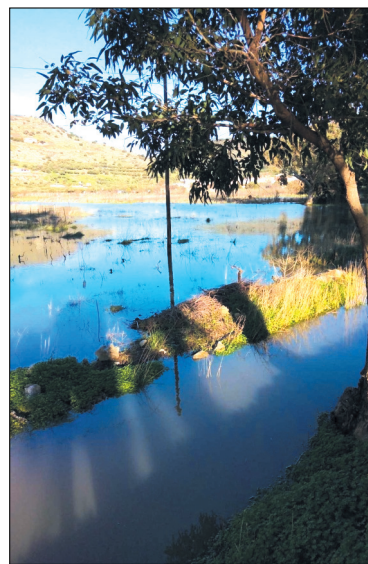
Ο κάμπος της Φουρνής πλημμυρισμένος

Για δεύτερη συνεχόμενη χρονιά η φετινή χειμερινή περίοδος πέρασε με τις βροχοπτώσεις να φθάνουν σε υψηλά βροχομετρικά μεγέθη. Οι βροχοπτώσεις συνεχίστηκαν και την ανοιξιάτικη περίοδο και μέχρι τις αρχές του καλοκαιριού είχαμε άστατο καιρό. Έτσι οι βροχοπτώσεις ξεπέρασαν το μέτρο, πράγμα το οποίο θα έχει πολύ ευνοϊκές συνέπειες στις καλλιέργειες και στην φύση γενικότερα. Ευτυχώς δεν είχαμε έντονα καιρικά φαινόμενα που να