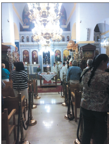
Από την γιορτή της Αγίας Τριάδας

Μετά από αρκετές ημέρες καθυστέρησης (ίσως οφείλεται αυτό στον κορονοϊό) άρχισαν οι εργασίες ανακατασκευής της στέγης του Σχολείου. Όλη η παλαιά στέγη ξηλώθηκε και άρχισαν οι εργασίες τοποθέτησης καινούριας. Από ότι φάνηκε η ξυλεία της οροφής ήταν σαπισμένη και αυτός ήταν και ο λόγος που έβα-