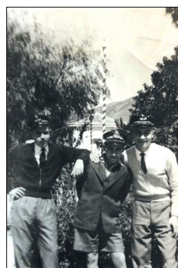
Μετά από την παρέλαση Νεαπόλεως (25 Μαρτίου 1959)

Οι καρέκλες έμπαιναν σε σειρές όπως στα θέατρα και η σκηνή σπινόταν πρόχειρα στη βορεινή πλευρά Η Πίτσα Τζα ήταν μια στρουμπουλή σαραντάρα, που πρωταγωνιστούσε στα έργα "Γκόλφω", "Πριγκίπισσα" κ.λπ.