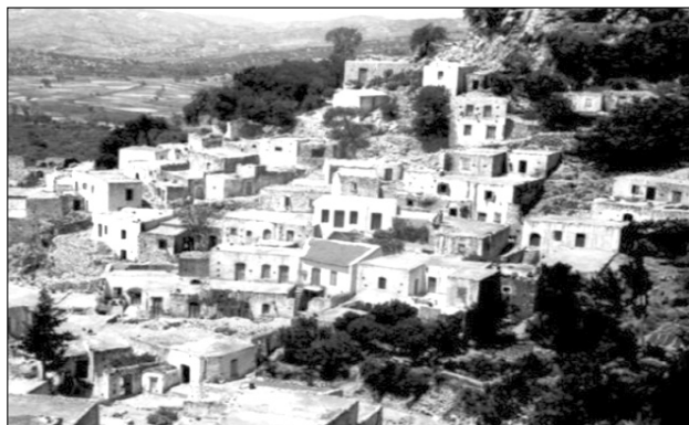
Βιάννος σε φωτογραφία Γερμανού «τουρίστα» (Ιούλιος 1943)

Μαζικές εκτελέσεις, συνήθως, ανδρών, κάψιμο ζωντανών, συνήθως, ανήμπορων να μετακινηθούν, ομηρία κατοίκων σε φυλακή, ξεριζωμός των γυναικόπαιδων και των ηλικιωμένων από τις εστίες τους και λεηλασία των υπάρχοντων τους, πυρπόληση και ισοπέδωση ολοκληρωμένων χωριών. Οι πληγές των κατοίκων αυτών των χωριών, πολύ βαθιές, τους σημάδεψαν δια βίου. Ακόμη και σήμερα βρίσκονται ανάμεσά μας, όχι μόνον τα τότε πενήχρονα, που βίωσαν, ακόμη και μπροστά στα μάτια τους, τη βίαιη απώλεια των δικών τους. Πλήθος καταγεγραμμένων μαρτυριών αυτοπτών έχει περάσει στην Ιστορία, ενώ γερμανικό φωτογραφικό υλικό τεκμηριώνει τις φρικαλεότητες 6 . Αυθόρμητο και το ερώτημα, πώς πρέπει να αντιμετωπίζονται τα παιδιά και τα εγγόνια των μακελάρηδων, σημερινού επισκέπτες της Μεγαλόνησου; Η ευθύνη μεταφέρεται από γενιά σε γενιά;