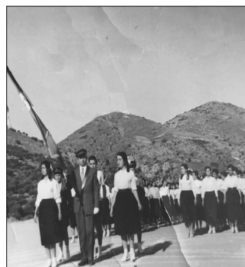
Επιδείξεις Γυμνασίου (1958)